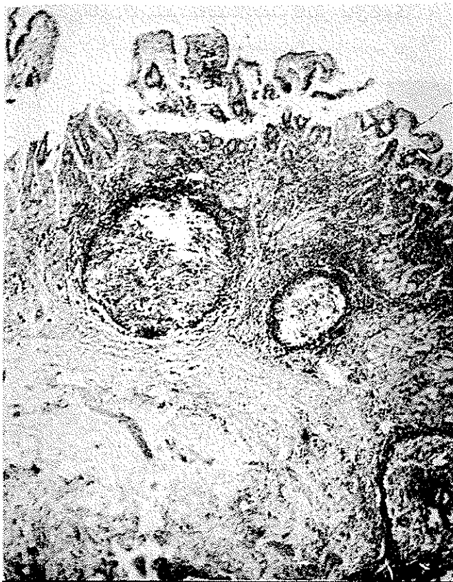
تصویر ۲ - مخاط توسط سلولهای لنفوئید انفیلتره شده و فولیکولهای لنفوئید با مراکز واکنشی دیده میشود. زیر مخاط فیبروتیک است.

راد یولوژیک و اندوسکوپی، تومور آنتر معده بود. در این مورد عمل جراحی گاسترکتومی ساب توتال (Subtotal) بعمل آمد و گزارش پاتولوژی به شرح زیر است: