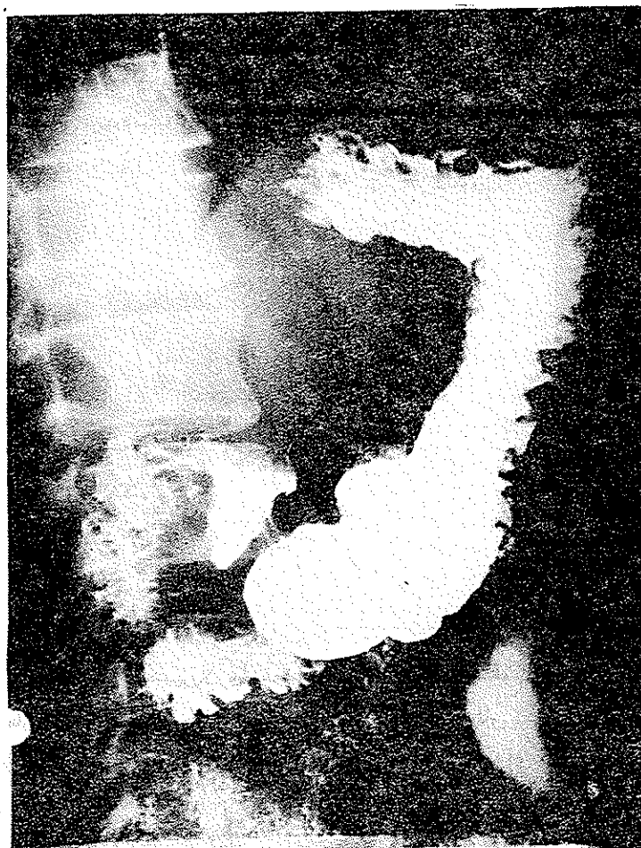
تصویر ۳ - مربوط به بیمار دوم

ارتشاح کانون‌های لنفوسیت‌ریمی باشد. ارتشاح کانون‌های کوچک لنفوسیت‌ر در لابلاهی عضله و سروز هم مشهود است (تصویر ۵ و ۶).