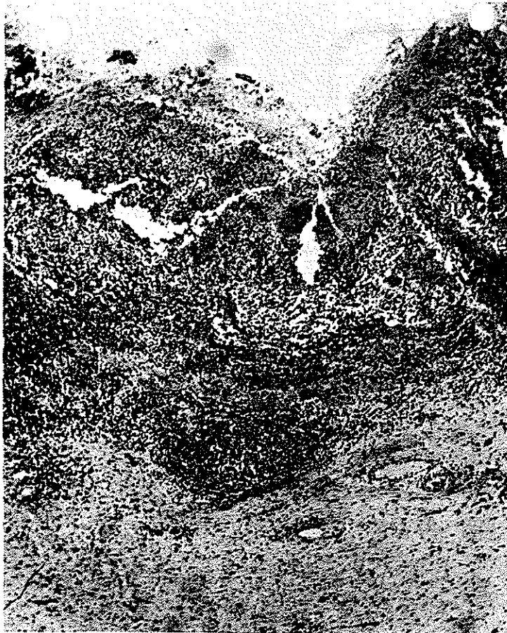
تصویر ۱ - سطح مخاطی زخمی است . انفیلتراسیون سلولهای لنفوئیدی فیروز زیر مخاطی دیده میشود .

معده مشاهده گردید که بیوپسی به عمل آمد و تشخیص آسیب شناسی لنفوم بدخیم گزارش شد . بیمار تحت عمل گاسترکتومی ساب توتال (Subtotal) ، امنتکتومی و اسپلنکتومی قرار گرفت . گزارش پاتولوژی آن به شرح زیر میباشد : ماکروسکوپی : معده شامل رزکسیون ساب توتال معده ، انحنای بزرگ به طول ۱۶ سانتی متر و انحنای کوچک به طول ۹ سانتی متر است . قطر دهانه پروگزیمال ۹ سانتی متر و قطر دهانه دیستال ۴ سانتی متر میباشد . به معده ، امنتوم بسه اقطار ۲۳×۲۳ سانتی متر متصل است . در برش در ۲/۵ سانتی متری دهانه دیستال برآمدگی با سطح زخمی به بزرگترین قطر ۵/۵ سانتی متر معده را انفیلتره کرده است . در جستجوی انحنای بزرگ ۲ غده لنفاوی ، در انحنای کوچک ۷ غده لنفاوی