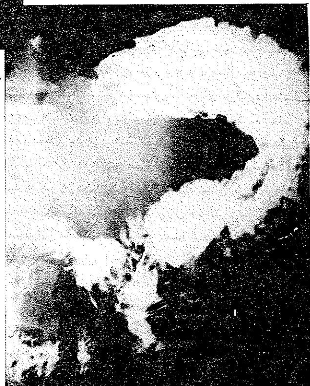
تصویر ۴ - مربوط به بیمار دوم