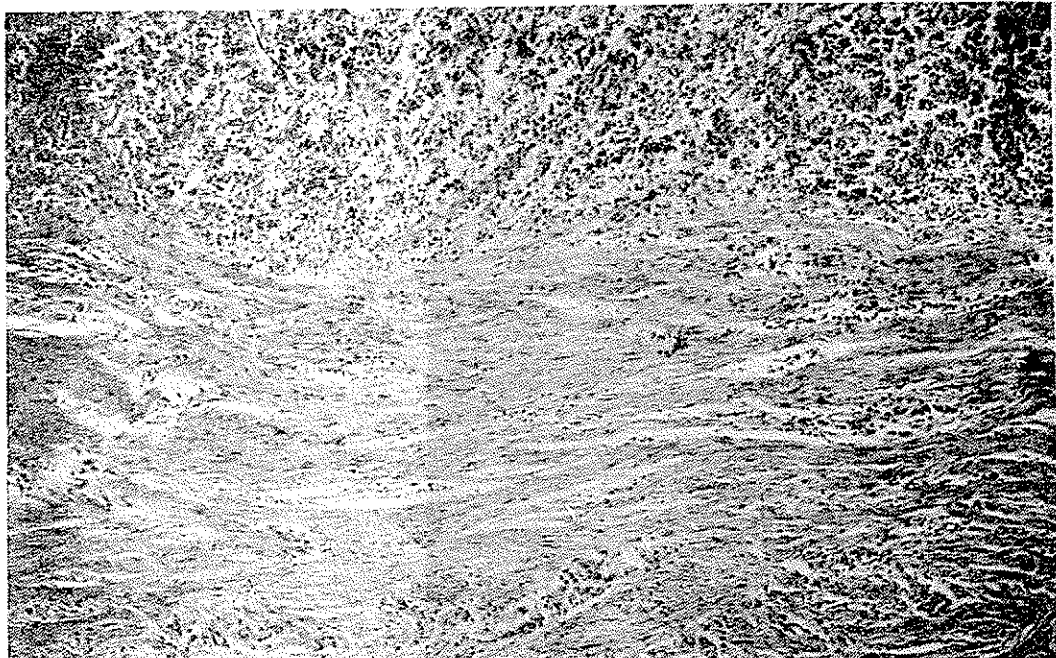
تصویر ۶ - قسمت عمقی مخاط و زیرمخاط است . در مخاط انفیلتراسیون شدید سلولهای لنفوئید و در زیر مخاط فیبروز شدید با انفیلتراسیون لنفوئید بصورت کانونهای کوچک مشاهده میشود .