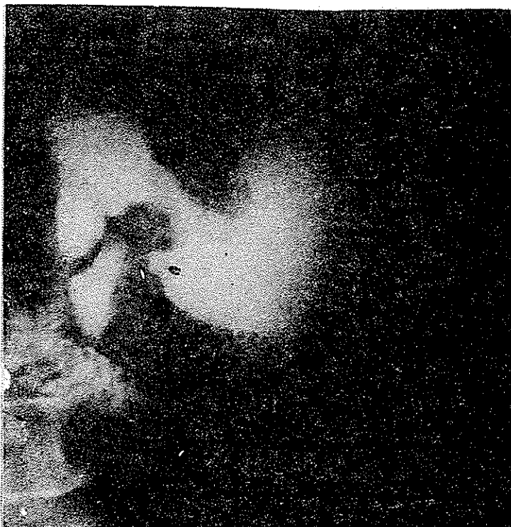
تصویر ۷ - مربوط به بیمار سوم

این بیمار تحت عمل گاسترکتومی پارسیال (Partial) قرار گرفت و گزارش پاتولوژی آن به شرح زیر میباشد: